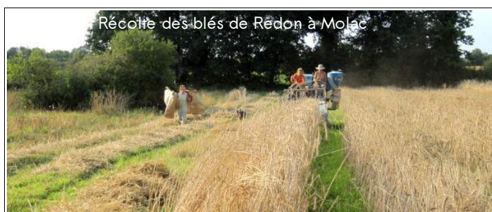
Récolte des blés de Redon à Molac