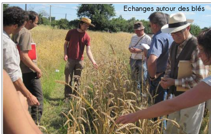
Echanges autour des blés

vendredi 1er juillet 2011 à la ferme de Carafray