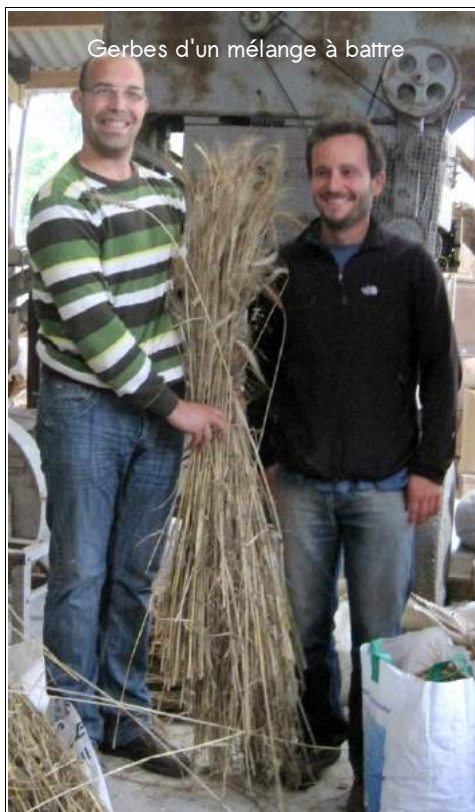
Gerbes d'un mélange à battre