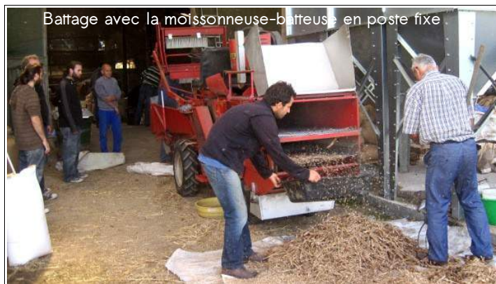
Battage avec la moissonneuse-batteuse en poste fixe

Battages collectifs à Bouchemaine (11 septembre)