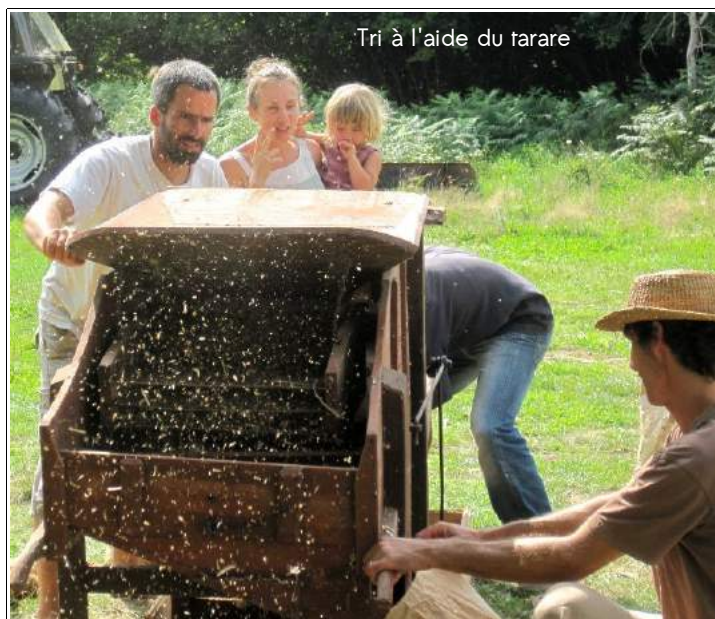
Tri à l'aide du tarare

Battages collectifs à Bouchemaine (11 septembre)