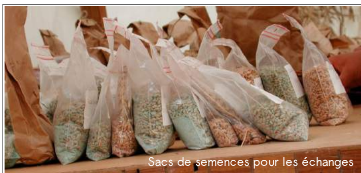
Sacs de semences pour les échanges