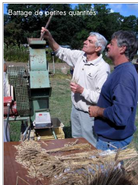
Battage de petites quantités

1) - vous avez la possibilité de moissonner, avant cet essai de