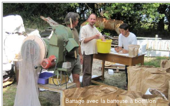
Battage avec la batteuse à bottillon