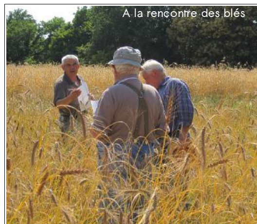
A la rencontre des blés

Des paysans du coin étaient présents, désireux de mieux comprendre la démarche et ce qu'on peut dire de ces beaux blés. C'était aussi l'occasion de discuter tout simplement de la saison et de ce temps sec qui a mis à l'épreuve les blés cette année.